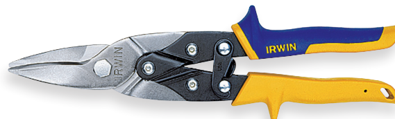
Tesoura Tipo Aviação corte reto e curvas amplas cód. 14079