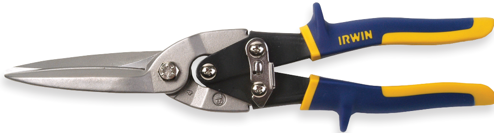
Tesoura Tipo Extra Cut cód. 14075