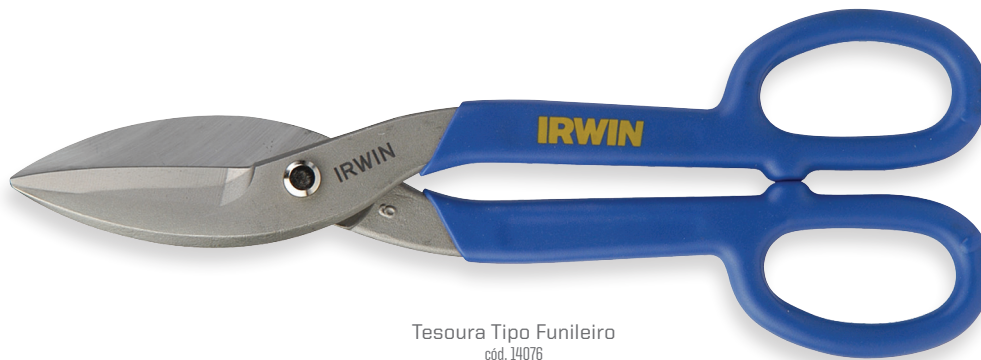
Tesoura Tipo Funileiro cód. 14076